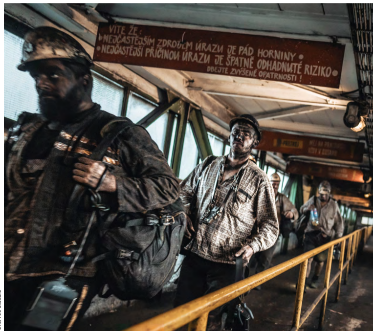
Na sociální program pro odcházející zaměstnance má společnost vyhrazeno 1,3 mld. korun.

Po výtěžení posledních porubů v 1. čtvrtletí 2026 provede OKD na základě Usnesení vlády č. 303 ze 7. května 2024 technickou likvidaci Dolu