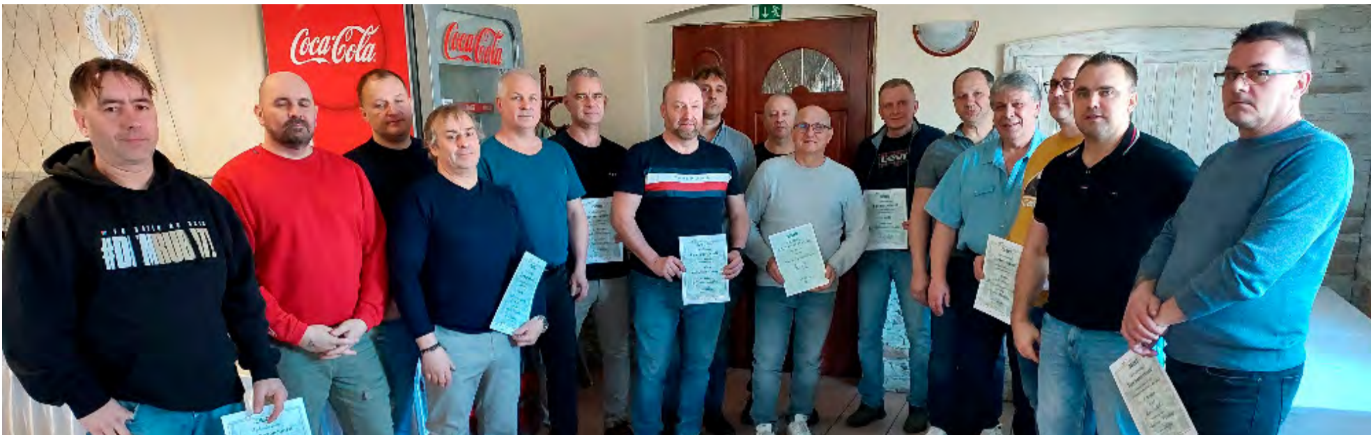
Hlavní předáci a vedoucí úseků, kteří získali ocenění za vynikající výsledky dosažené v březnu v oblasti bezpečnosti práce, nebo splnili limitní výkony.