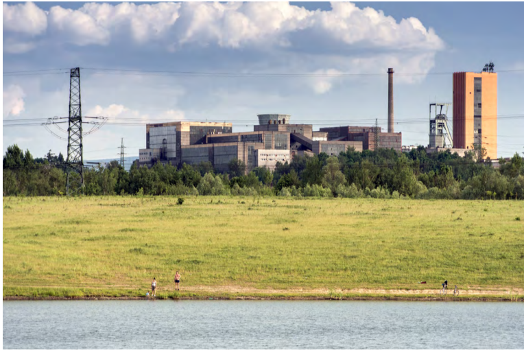
Likvidaci Dolu ČSM bude provádět OKD z vlastních prostředků.