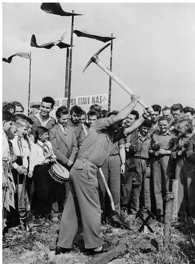
Ve Stonavě u zarážkového bodu, označujícího první těžní jámu, se 1. září 1958 konalo slavnostní zahájení výstavby nejmodernějšího dolu ČSM v Československu.

Někomu se může zdát podíl mládežníků na přípravě výstavby dolu, která trvala deset let, jako ne pří-