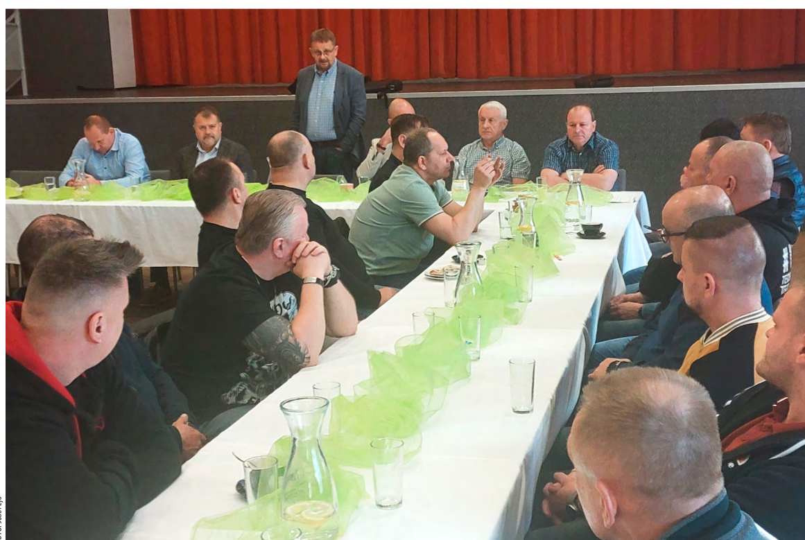
Pohled do sálu kulturního domu PZKO ve Stonavě, kde se 4. dubna konalo setkání vedení OKD s hlavními předáky a vedoucími úseků Dolu ČSM.