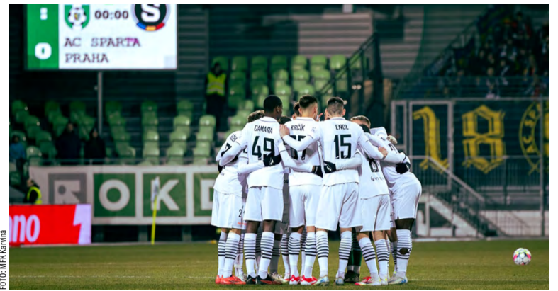
Krásný úvod, ale nakonec to Karviné se Spartou nevyšlo.

Běží z SK Fuga v poháru samozřejmě na startu kromě závodníků bojujících o umístění rádi uvidí každého, kdo se bude chtít přidat a zúčastnit se. „Kromě bodování do poháru se každý závod totiž vyhlašuje i samostatně. Doufáme, že běžec pohár bude mít čím dál větší popularitu a věříme v hojnou účast,“ dodává Hlaváč.