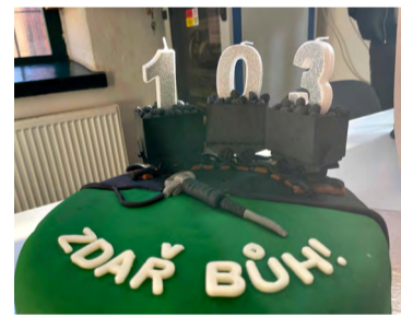
I dort byl stylový.