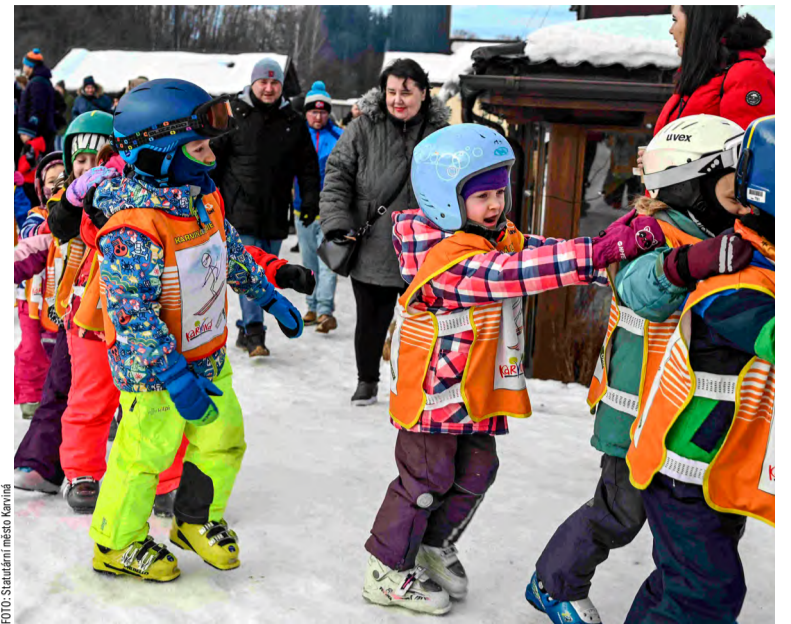
Karvinské děti opět lyžují i díky těžařské nadaci.