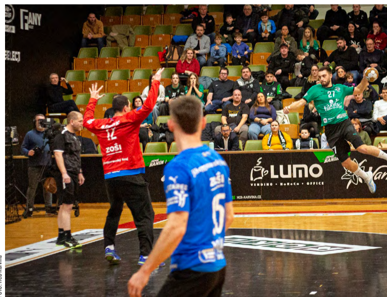
Karvinský klub v akci.

Upozorňuje také, že se zároveň blíží konec základní části extraligy a nadcházející play-off, kde bude Karviná patřit mezi jasné favority. V týmu si však uvědomují, že vy-