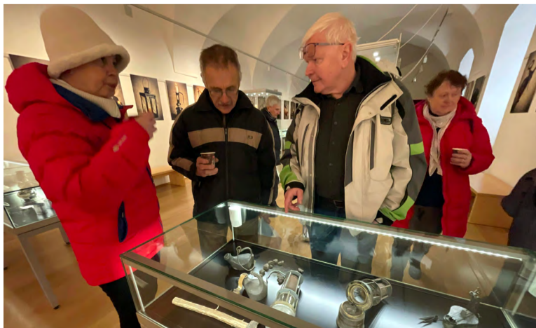
Návštěvníci příbořské výstavy o světle.

Kahaný jsou v CETRAT k vidění do konce května spolu s dalšími třemi desítkami exponátů – od ocílek na křesání jisker pomocí pazourku, přes svíčky a svícny mnoha druhů, po zákopové svíce vytvářené vojáky z plechovek od konzerv, papíru a loje.