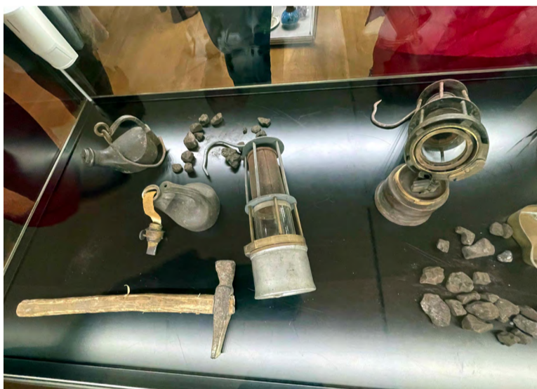
Historické hornické kahaný.

„Myslím si, že lávka upevní společenské vztahy mezi obyvateli na obou stranách hranice a rodiny, které rozděluje řeka, to budou mít k sobě blíže,“ dodává primátor Wolf.