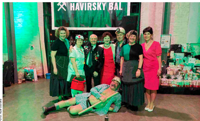
Havířský bál v Brick House v Ostravě.

„Havířský bál má určitě v Ostravě svoji tradici a diváci fandili jak na Baníku! Chutná večere, kvalitní víno a do toho ještě akrobatické vystoupení „gorolských synků“ na vysoké úrovni. Na programu bylo i taneční překvapení, přímo bomba – temperamentní španělský tanec za zvuků kastanů! Ani jsme se nenadáli a byla jedna hodina po půlnoci. Moja pravidla: „Vidíš táto a vydrželi jsme to! Loučili jsme se plni dobrých zážitků a dojmů. Havířské tradice a zvyky jsou na Hlubině v dobrých rukou!“ zakončil předseda Koordinačního výboru hornických důchodců OKD.