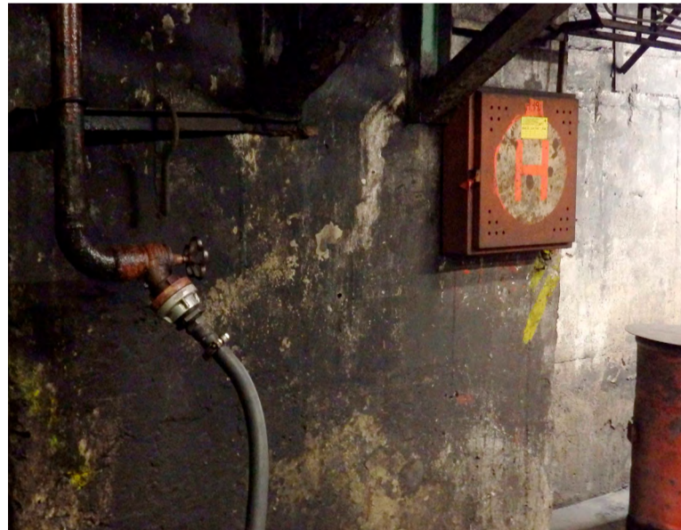
Příklady špatné praxe! Protipožární zařízení je pro snížení rizika požáru nutno udržovat v naprostém pořádku.

Ve vyhlášce báňské správy mimo jiné stojí, že pracovníci nesmějí bez příkazu nic měnit na provozních, bezpečnostních, požárních, hygienických a jiných zařízeních. Stejně tak nesmí dělat práce, které mohou vést ke vzniku požáru (nemají-li odbornou způsobilost požadovanou pro výkon takových prací) nebo mohou omezit či znemožnit použití označených nástupních ploch pro požární techniku (třeba části parkoviště), nesmí zastavovat materiálem únikové východy, cesty, uzávěry médií, hydranty a hasicí přístroje či vědomě bezdůvodně přivolat jednotku požární ochrany nebo zneužít linku tísňového volání. „A samozřejmě je také zakázáno po-