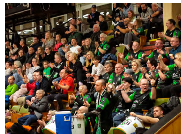
Věrní fanoušci karvinské házené.

řazovací boje jsou nevyzpytatelné. „Největší výzvou bude tradičně Plzeň, ale i Dukla hraje kvalitní, rychlou házenou. Musíme být maximálně koncentrovaní a nic nepodcenit, pokud chceme dojít až na vrchol,“ konstatuje Užek.