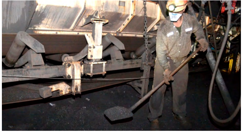
K protiprašné prevenci patří zneškodňování uhelného prachu pod pásy.