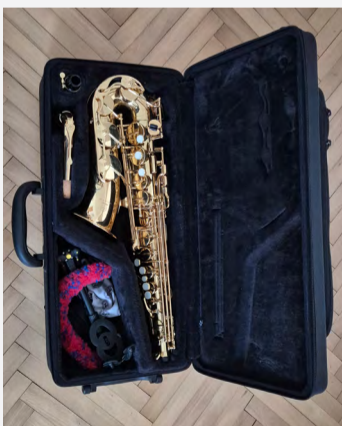
Domácké zátiší se saxofonem.

„Vzhledem k tomu, že rodiče mě i sourozence vedli k hudbě od mládí, muzicíroval jsem ve školním věku nejprve na zobcovou flétnu a potom i na klarinet a kytaru. Bohužel výuka hry na hudební nástroj v té době nebyla příliš atraktivní, tak jsem si ji zpestřoval zejména hraním v malém dechovém tělese, se kterým jsme absolvovali i několik soutěží,“ pokračoval.