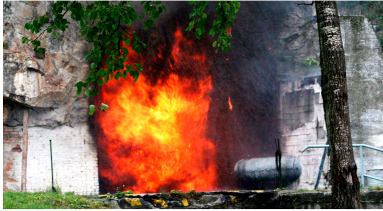
Jednostranně ohraničený výbuch hnědouhelného prachu ze cvičné štoly.

Co se zavlažování týče, už před zahájením provozu pracoviště musí být v dostatečném předstihu zpracován technologický postup, a to i s ohledem na projekty protivýbuchových opatření. S tímto dokumentem musí být prokazatelně seznámeni zaměstnanci provádějící zavlažování. Před zahájením provozu pracoviště se dodržuje předstih zavlažení stanovený technologickým postupem nebo