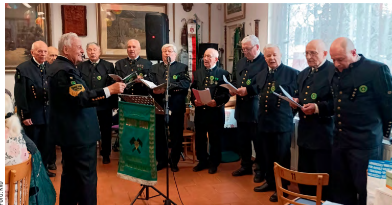
Havířský bál v Domečku v Horní Suché.

„V sále Brick House, což jsou vlastně bývalé koupelny Dolu Hlubina, se začínalo v sobotu 8. února až před