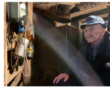
Nejstarší žijící horník v Dole Anselm.