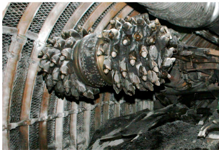
Nejvyšší lednový postup byl na čelbě s kombajnem MR 340.

K čelbám provozní ředitel doplnil, že dobrý pozor by si měli dát hlavní raziči ve 40. sloji na případné vícevýlomy v nadloží při přípravě porubu 402 204, které mohou způsobit průtahy do stařin sloje vydobyté v bezprostředním nadloží.