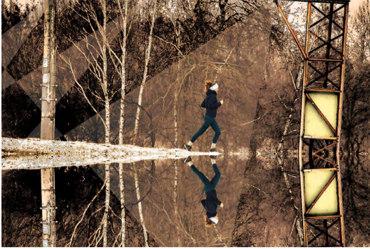
Běhání zajímavým prostředím hornické krajiny.

KARVINÁ – Důl Pokrok (Julius Fučík) v Petřvaldě se stane v březnu nejbližším dějištěm sportovního seriálu H10: Běžec pohár Karvinského revíru 2025. Na místech spojených s horníky a těžbou uhlí ho organizuje oddíl SK Fuga.