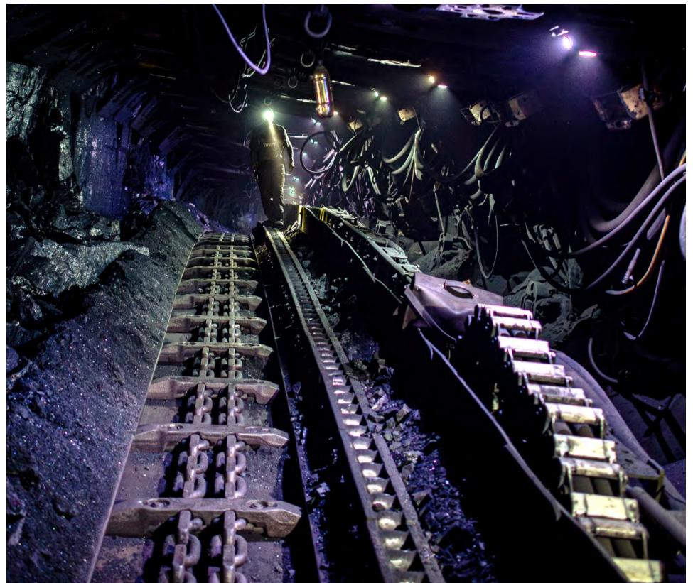
Na stonavské šachtě najely v průběhu ledna první dvě letošní porubní kapacity.