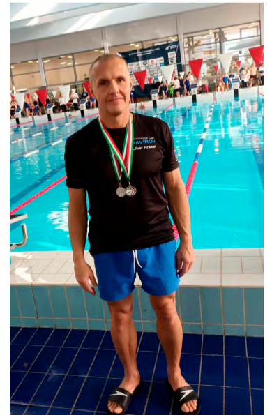
Posbíral znovu medaile i další úspěchy.

„V bazénu jsem samozřejmě denně, plavu přibližně půldruhé hodiny,“ doplnil Hracki ke své přípravě.