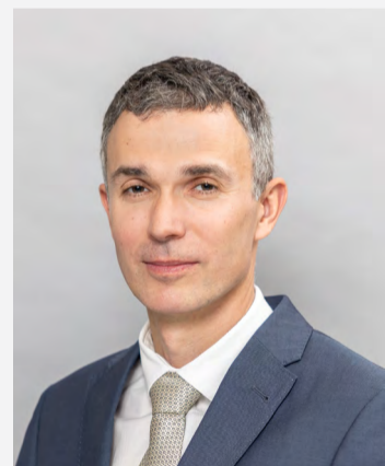
Obchodní ředitel OKD.

„Můj učitel mi pomáhá zejména se zvládnutím jazzových skladeb, které