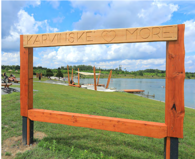
Darkovské moře – místo odpočinku nejen obyvatel Karviné.

KARVINÁ – Úspěšný rekultivační projekt společnosti OKD a areál provozovaný iniciativou podporovanou firemní Nadací OKD se loni staly nejnavštěvovanějšími lokalitami v Karviné. Jednalo se o Darkovské moře s výhledem na Důl ČSM a Lodičky v zelené oáze ve Fryštátě!