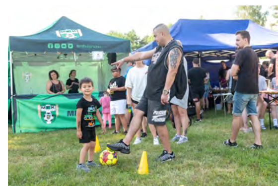
Na akci nechyběl ani MFK Karviná.