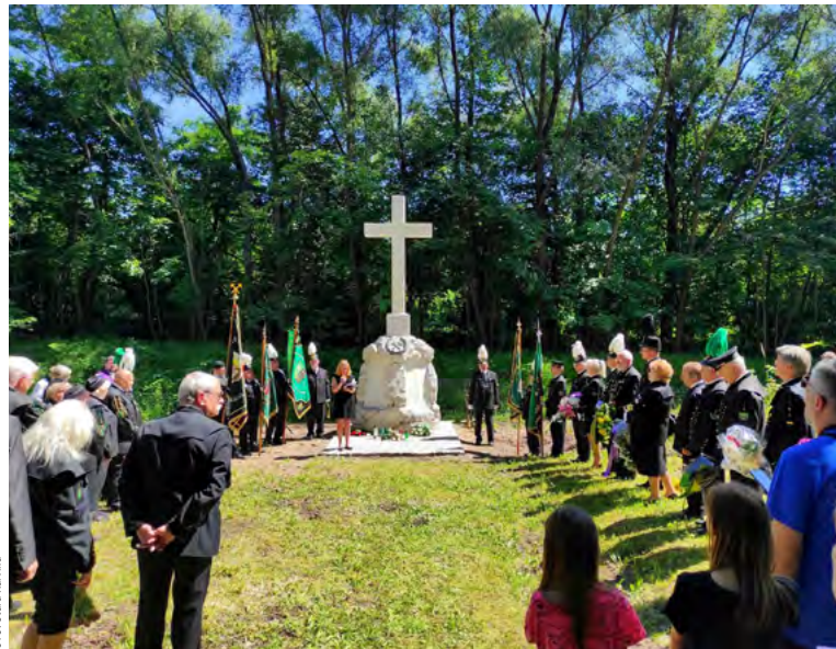
Pietní akt u renovovaného památníku obětí důlní katastrofy v roce 1894 v Karviné.

Zmínil též, že osmdesát procent obětí následků výbuchu metanu a uhelného prachu zahynulo v dů-