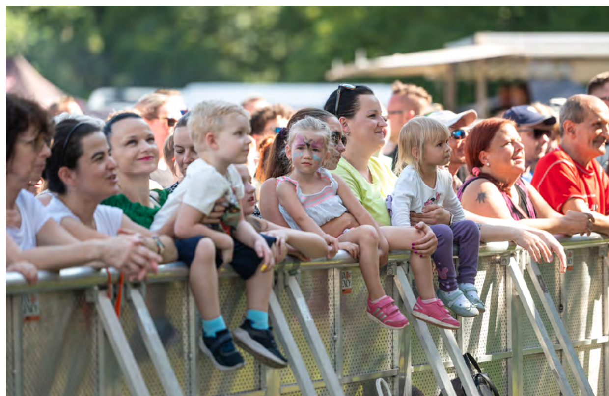
Program myslel na malé i velké návštěvníky.