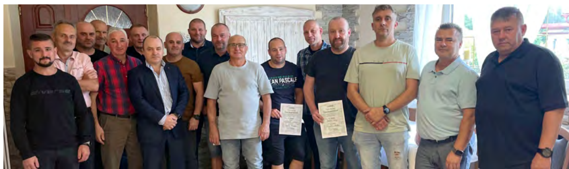
Vyhlášení nejlepších v BOZP za květen.