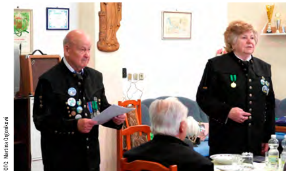
Předsedkyně klubu s nejstarším členem na karvinském úřadě.