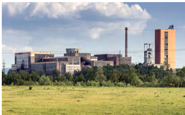
Technickou likvidaci ČSM provede OKD.

OKD, jak dále informoval, předpokládá na poslední tužemské černouhelné šachtě ukončení těžby na přelomu let 2025 a 2026. Poté bude přibližně tři roky provádět technickou likvidaci Dolu ČSM a připravuje se na případné další podnikání, a to v oblasti výroby uhelných směsí a zelené energie. „Fakt, že OKD po posledním vozíku nezakopne, je dobrou zprávou pro naše zaměstnance, kteří zde budou chtít pracovat i po ukončení těžby. Pro technickou likvidaci a plánované podnikatelské aktivity budeme nadále potřebovat několik set pracovníků,“ doplnil Sikora.