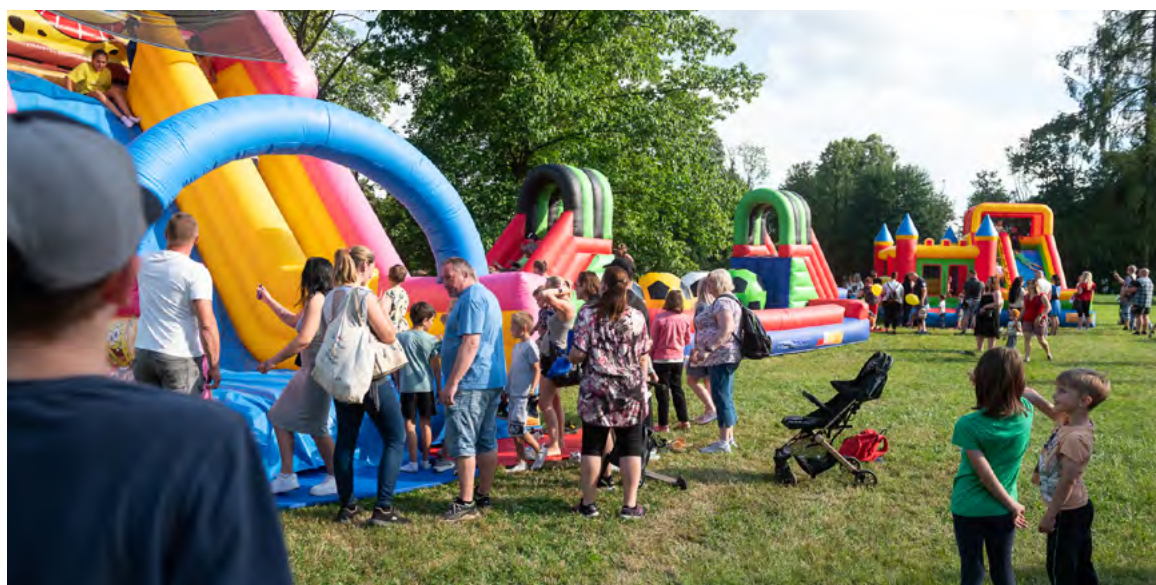
Malé návštěvníky potěšily nafukovací atrakce.