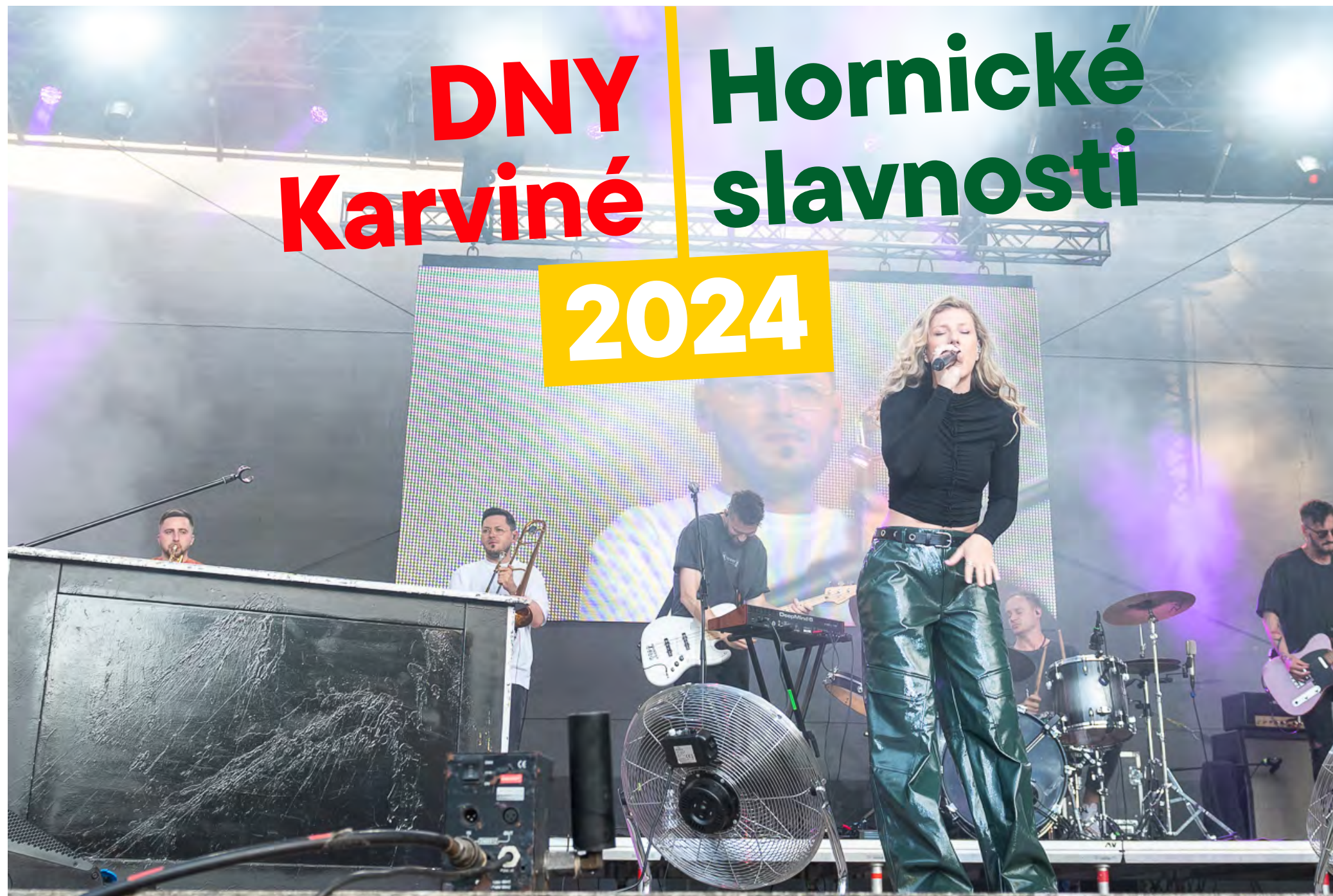
Držitelka ceny Anděl Lenny.