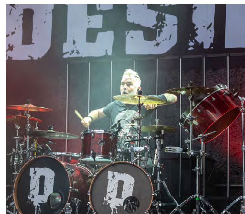
Sedminásobný držitel slovenského Zlatého slávika kapela DESmod.