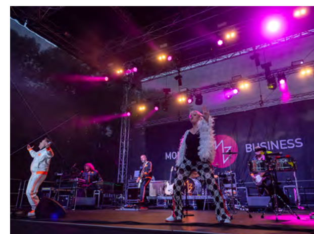
Kapela Monkey Business předvedla skvělou show.