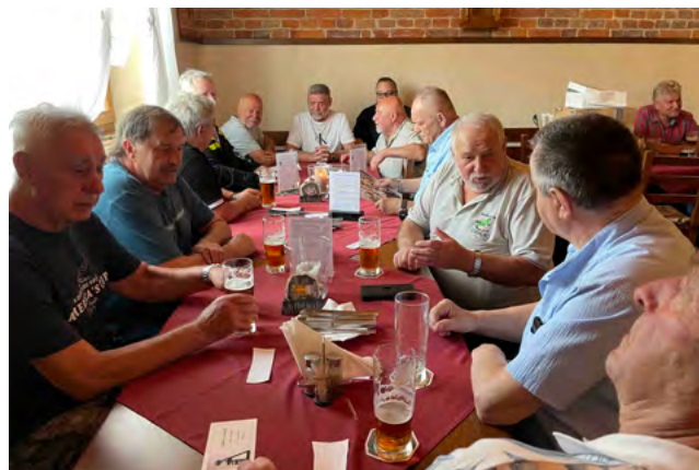
Setkání starých „čeesemáků“ ve Fryštátské chalupě.