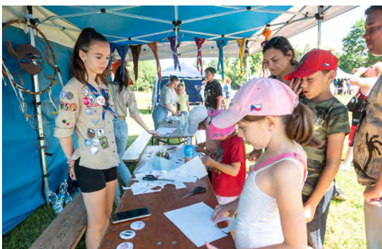
Kreativní dílničky NOKD.