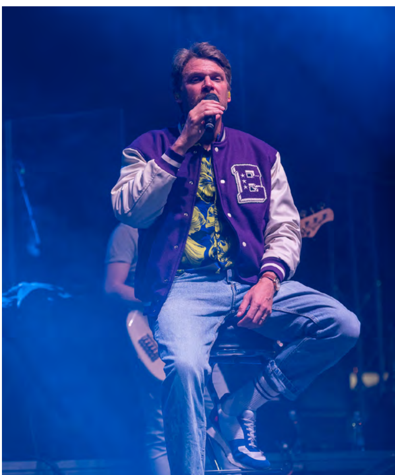
Publikum bavil i Vojtěch Dyk s kapelou D.Y.K.