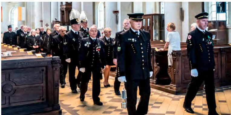
Svatoprokopská slavnost v ostravské katedrále.

OSTRAVA – Patrona horníků a hutníků sv. Prokopa si havířská veřejnost připomněla v pátek 21. června v ostravské katedrále Božského Spasitele.