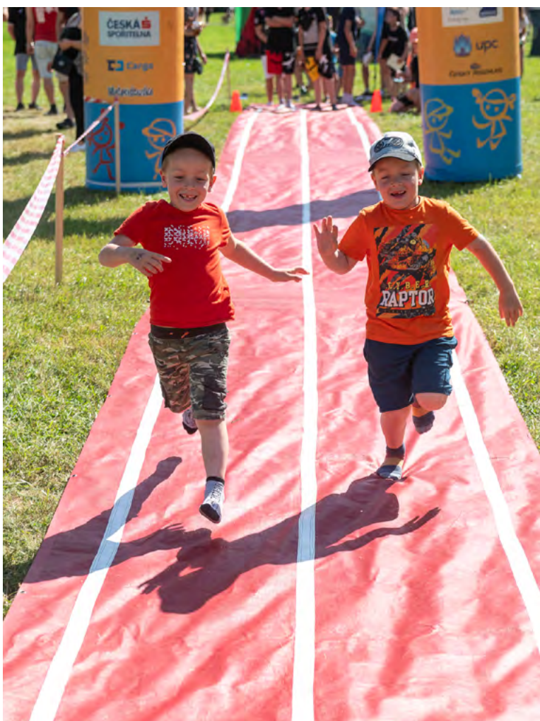
Děti si také zasportovaly.