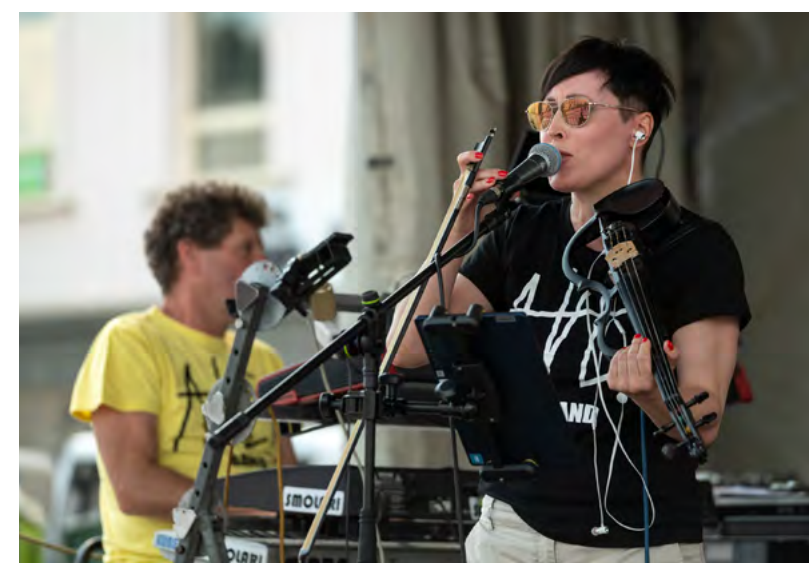
Lokální kapela Ave!Band.