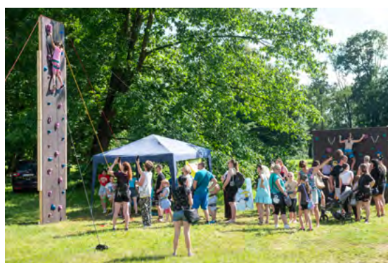
Horolezecká stěna pro děti.