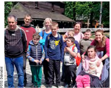
Dobrodiní na Valašsku.

Účastníci si zde osvojovali fungování v jiném prostředí, než jsou zvyklí. V rámci rozvoje sociálních dovedností se spolupodíleli na přípravě snídaní i sebeobslužných činnostech. Zapojili se do všech tvůrčích i sportovních aktivit. Přitom si rozvíjeli schopnosti ve všech oblastech komunikace a sociální interakce. „Vyzkoušeli si malbu s předlohou na přírodniny a výrobu náramku. Zajímali se o přírodní jevy a vytvořili mravčičí farmu, kde pozorovali život mravčenců. Poznávali krásy okolní přírody a života na Valašsku. Byli jsme na výletě v Rožnově pod Radhoštěm, kde jsme si prohlédli expozici Svět kamenů,