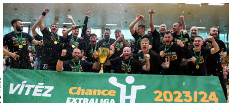
Obrovská radost karvinských házenkářů.

Český pohár vybojovali házenkáři Karviné se Zubří a v extraligovém finále porazili v play-off 3:1 Plzeň.