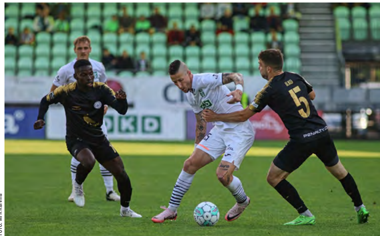
MFK uvidíme i v další sezoně v nejvyšší české fotbalové soutěži.

Karvinský klub se už také dozvěděl, co ho i jeho fanouškovskou základnu čeká. „Sezona 2024/2025 byla rozlosována. Zahájíme ji v domácím prostředí proti Liberci, pak pojedeme do Pardubic, první víkend v srpnu při-