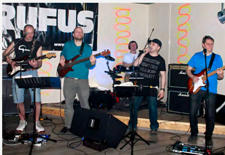
S touto partou hrává na plesích a zábavách.

Pomozte nám tvořit tuto rubriku! Máte zajímavého nebo neobvyklého koníčka, dokázali jste něco výjimečného a chcete se o to podělit? Nebo máte takového partáka? Napište na barbora.cerna-dvorakova@okd.cz nebo zavolejte na 606 774 346.