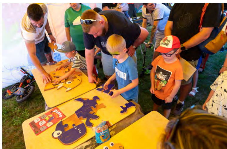
Soutěže s dinosaurí tématikou.