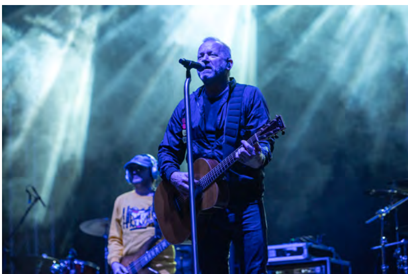
K hlavním hvězdám patřil David Koller.