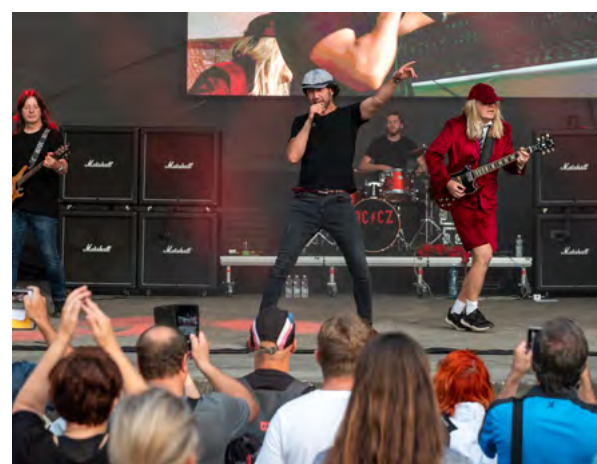
Příznivce rockové hudby potěšilo vystoupení AC/CZ.